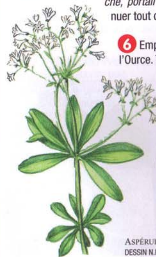
ASPÉRULE ODORANTE / DESSIN N.L.

À l'église, tourner à gauche, puis aller à droite pour rejoindre le parking.